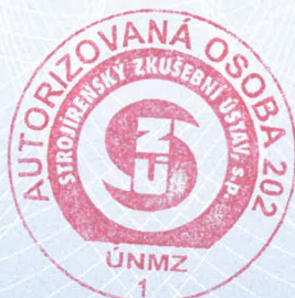
Ing. Tomáš Hruška ředitel

202/C5/2015/B-30-00408-15-rev. 2 Strana 1 (2)